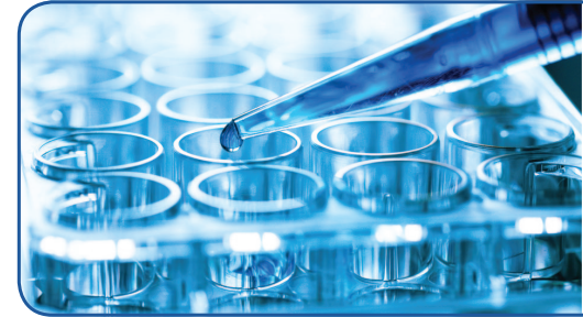
Untersuchung von Bioproben im Rahmen genetischer Studien

In der Studie wurden die Gene von Menschen europäischer und japanischer Abstammung mit und ohne Vorhofflimmern miteinander verglichen. Dazu wurden Blut- bzw. DNA-Proben von insgesamt 64.683 Europäern und 11.309 Japanern aus mehreren großen Studien untersucht und die Daten in einer Meta-Analyse verglichen. Ein Teil der Proben stammt aus dem AFNET: 1.500 Vorhofflimmerpatienten wurden für das AFNET Projekt „Genetische Ursachen von Vorhofflimmern“ unter Leitung von Prof. Kääb, Klinikum Großhadern, Universität München, rekrutiert. In der Referenzgruppe sind mehr als 4.000 Personen aus der KORA Kohorte, einer großen epidemiologischen Studie im Raum Augsburg, enthalten. Prof. Kääb fasst die wesentlichen Ergebnisse der Studie so zusammen: „Die aktuelle Untersuchung zeigt, dass an einem der neun Gene mindestens vier unabhängige Signale mit dem Risiko für Vorhofflimmern verknüpft sind und eröffnet damit einen besseren Einblick in die möglichen Signalwege und potentiellen Krankheitsgene. Die Kombination aller zwölf genetischen Marker ermöglicht eine Risikobeurteilung bis zu einem fünffach erhöhten Risiko bei Vorliegen aller Risikomerkmalen.“