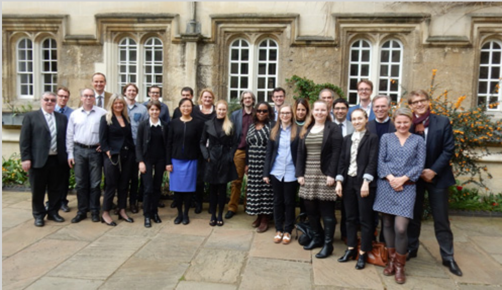
Die Teilnehmer des CATCH ME M12 Meetings in Oxford