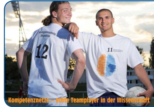
Kompetenznetze – echte Teamplayer in der Wissenschaft

Aufbauend auf allen verfügbaren Informationen will das Expertengremium Perspektiven für neue Ansätze in Diagnostik und Therapie definieren. Das Ergebnis dieser Konsensuskonferenz soll Vorschläge für notwendige klinische